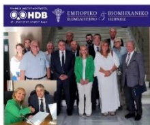
Πειραιός, 24/08/2022 - Προσηλυτικό συνέδριο μεταξύ της Ελληνικής Αναπτυξιακής Τράπεζας (HDB) και του Εμπορικού και Βιομηχανικού Επιμελητηρίου Πειραιώς